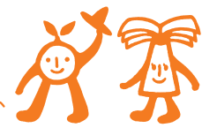
Welcomingあべの・天王寺キャンペーンの キャラクター「あのんくん」と「てのんちゃん」

あべの・天王寺エリアの魅力を再発見し、それを伝えることで、 エリアのイメージ向上、活性化を目指していきます。 「Welcoming」は、あべの・天王寺エリアにさまざまな人をお招きし、 おもてなしをしていこうという気持ちを表現しています。