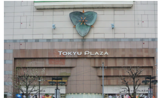
ロゴ変更後の「東急プラザ 渋谷」

ここで出会い、生まれる人と人、人とももの大きな「輪」を、PLAZA のイニシャル“P”に特徴的な変化を加えて表現しました。