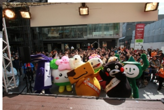
昨年3月の「アベノ・ひな祭り」の様子