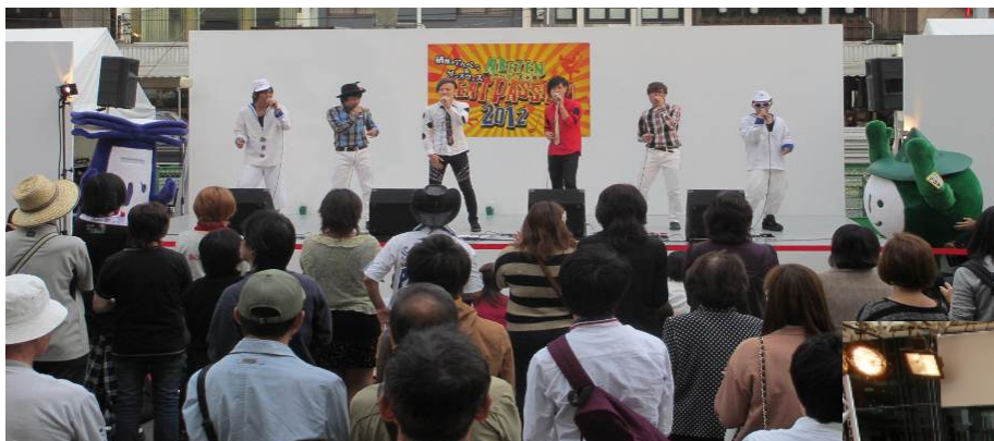
昨年10月の「ABETEN BEAT PASSION 2012」の様子

このイベントを通じ、一人でも多くの来街者様に“あべてん”の街の魅力を体感していただき、アカペラがあべてんエリアの新しい風物詩になることを願っています。