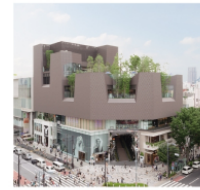
1. 東急プラザ 表参道原宿