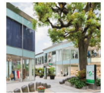
6. グラッセリア青山