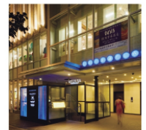
4. EBISU Q PLAZA