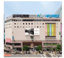
2. 東急プラザ 渋谷