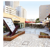
5. 代官山ラヴェリア