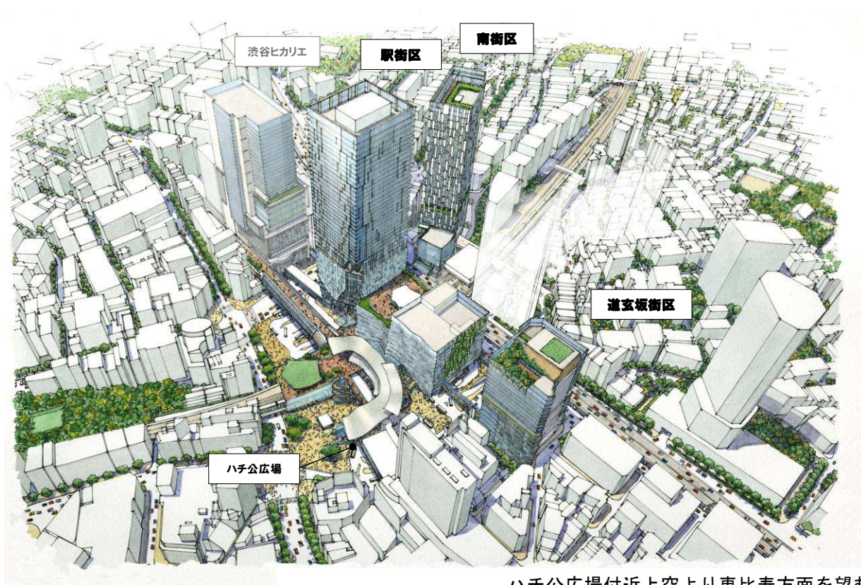
ハチ公広場付近上空より恵比寿方面を望む