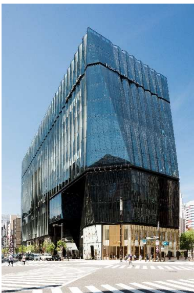
江戸切子をモチーフとした 「東急プラザ銀座」外観

「東急プラザ銀座」の屋上テラス「KIRIKO TERRACE(キリコテラス)」は、生物多様性保全にも配慮した大規模な壁面緑化とシンボルツリーの桜が魅力の屋外オープンペースです。株式会社石勝エクステリアが施工した壁面緑化は高さ6.5メートル、全長64メートル、約50種の草花を用いて、四季の移り変わりと植物の豊かな色彩を楽しむことができます。屋上緑化とともに、施設敷地における地上部での緑化と、隣接する数寄屋橋公園の再整備における緑化において、「緑の軸」である晴海通りに沿い、皇居・日比谷方面の自然と勝どき臨海部における自然生態系をつなぐネットワークを形成しています。