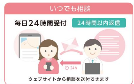
「産婦人科オンライン」

さらに、従前より提供しておりました「産婦人科オンライン」のサービス対象者も拡大いたします。これまで、産婦人科オンラインの利用対象者は「妊娠中～産後 2 年」としておりましたが、妊娠中・産後に関わらずご相談いただけるようになります。男性がパートナーに関するご相談を行うこと、妊活・不妊治療に関するご相談を行うことなども可能です。