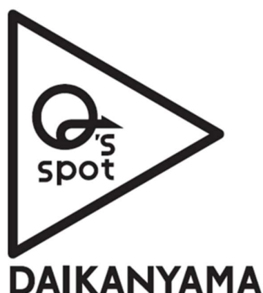
Q's spot DAIKANYAMA ロゴマーク

「Q's spot DAIKANYAMA」は、当社が代官山発の新しいビジネスとライフスタイルを創造する期間限定施設として2014年に開業した、「TENOHADAIKANYAMA(テノハダイカンヤマ)」内に誕生します。