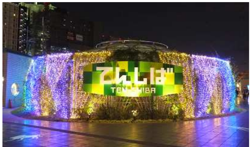
2016年度 天王寺公園エントランスエリアてんしばイルミネーション