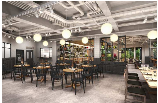
TENOHA & STYLE RESTAURANT