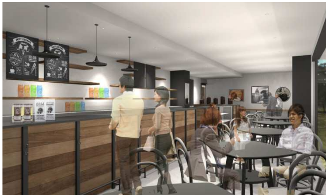
Bondolfiboncaffè (ボンドルフィボンカフェ)