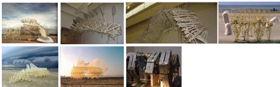
左上から Animaris Percipiere Primus, Animaris Varmiculus, Animaris Rugosus Paristhatis, Animaris geneticus-1997, Animaris Percipiere Rectus, Animaris Currens Ventosa, Animaris Rhinoceres Tabulae