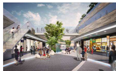
▲テラスマーケットイメージ①