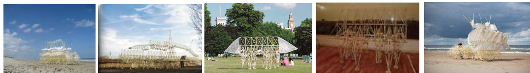
左から Animaris Siamesis, Animaris Percipiere Primus, Animaris Ordus (A)、Animaris Ordus (B)、Animaris Plaudents Vela