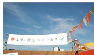
▲ENNICH by 太陽と星空のサーカス

ライブパフォーマンス、ワークショップ、マルシェ、映像作品の上映などを組み合わせた複合型イベントを開催。シンガーソングライター・bird(バード)などのアーティストによるライブのほか、「青空靴磨き教室」や移動式帽子屋「AURA」など、ワークショップ、雑貨、フードなど幅広いジャンルの約200のコンテンツが“縁日”を盛り上げます。