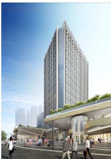
▲高層棟外観イメージ