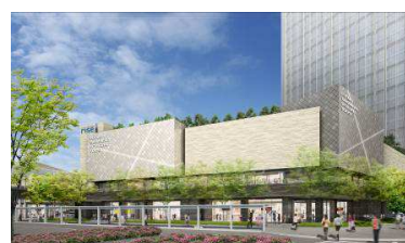
▲テラスマーケットイメージ②