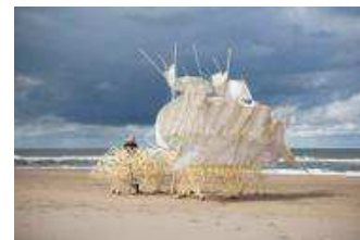
▲ストランドビースト「Animaris Plaudents Vela」

オランダの彫刻家・物理学者であるテオ・ヤンセン氏の世界的に有名な“風を食べて動く(=風力のみで生物のように可動する)”アート作品「ストランドビースト」を、商業施設として世界で初めて招致します。また、二子玉川ライズ内のデモンストレーションのみならず玉川高島屋S・Cでも展示。テオ・ヤンセン氏本人の来場も予定しています。