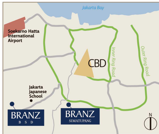
インドネシア中心部地図