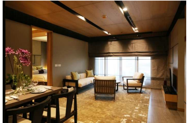
居室イメージ(モデルルームより)