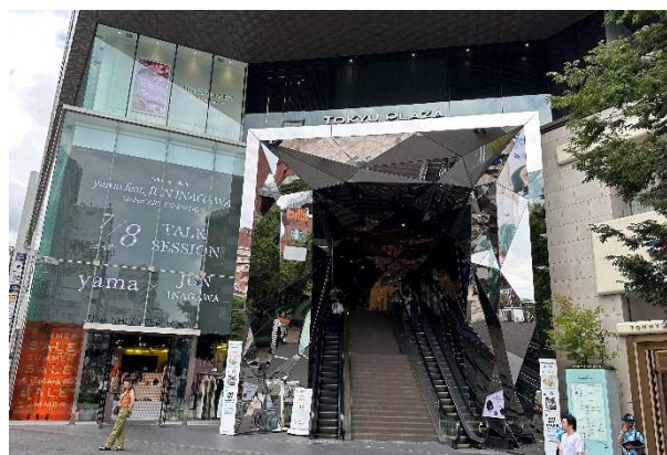
施設エントランスでのプロモーション