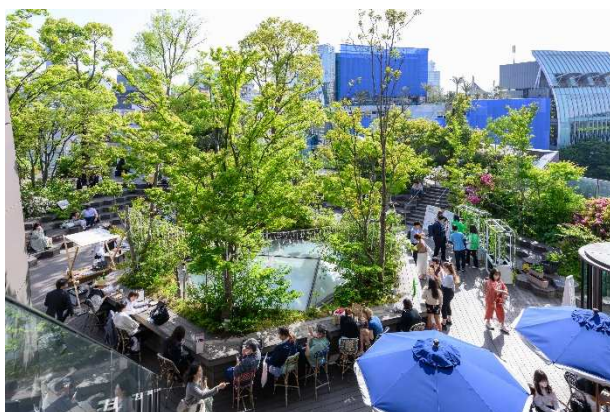
イベント開催イメージ

LOCUL では、フロア内にイベント・ポップアップスペースを設けるとともに、6 階「おもはらの森」でのイベントやエントランス広告と連動することで、プロモーションとしての表現の幅を広げます。