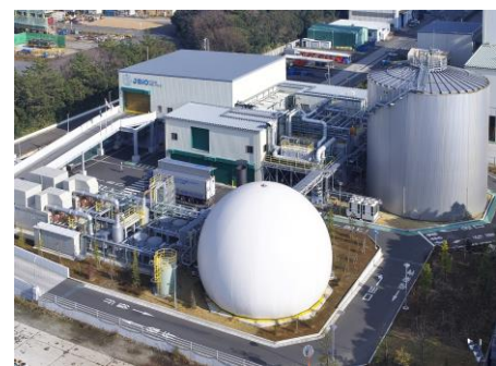
食品廃棄物 メタン発電施設 「Jバイオ横浜工場」