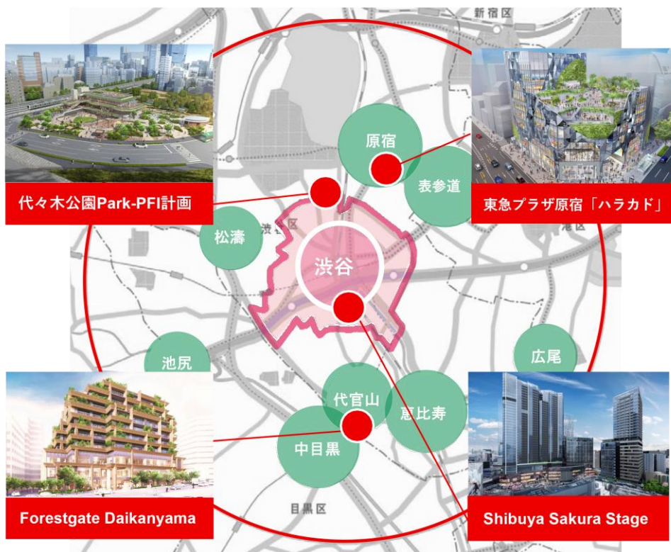
東急不動産の広域渋谷圏マップ