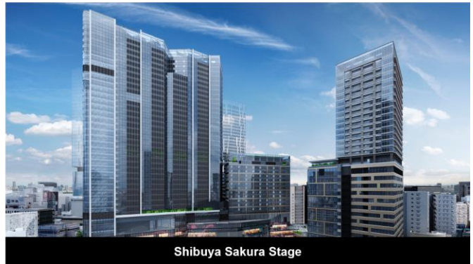
Shibuya Sakura Stage