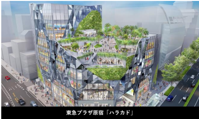
東急プラザ原宿「ハラカド」