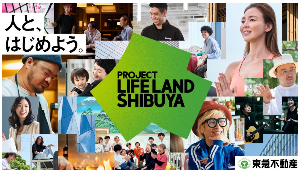
「PROJECT LIFE LAND SHIBUYA」のキービジュアル

当社は、広域渋谷圏というまちの魅力を高めるために、多様な人や企業との共創や、交流の仕組み・場づくりを通じて、「創造」「発信」「集積」を循環させ、共感する人や企業とパートナーシップやアライアンスを構築していきます。そしてこの度、当社とともに広域渋谷圏における新たな取り組みを行う「人」とはじめる、「PROJECT LIFE LAND SHIBUYA（以下「PLLS」）」を立ち上げることをお知らせいたします。