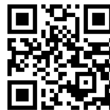
コンセプトムービーをご覧ください。

「PROJECT LIFE LAND SHIBUYA」ホームページ： https://www.life-land-shibuya.com/