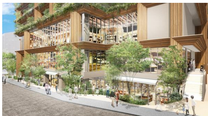
八幡通りイメージ