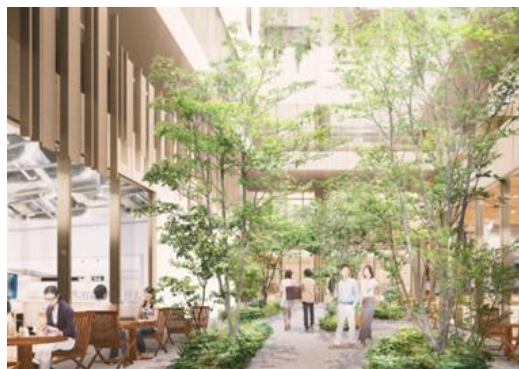
中庭通路イメージ

MAIN棟の低層部（地下1階～2階）においては、街に賑わいをもたらす、本物件の住民だけでなく、来街者・周辺住民にも豊かで新しいライフスタイルを提案する魅力的な商業ゾーンが広がっています。駅と八幡通りをつなぐアプローチ沿いにそれぞれの店舗が顔を出し、緑豊かな吹き抜けが広がっており、豊かな時間が流れるその場所には、『緑・環境サステナブル』と『食』を主軸とした、代官山ライフを実現するのにふさわしい店舗を揃えました。