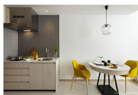
客室イメージ（プレミアム 53㎡）