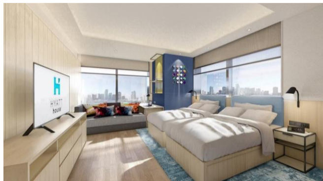
客室イメージ (左上：キング 32 ㎡、中下：プレミアム 53 ㎡、右上：デラックス 47 ㎡)