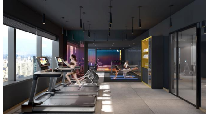
フィットネスジム イメージ