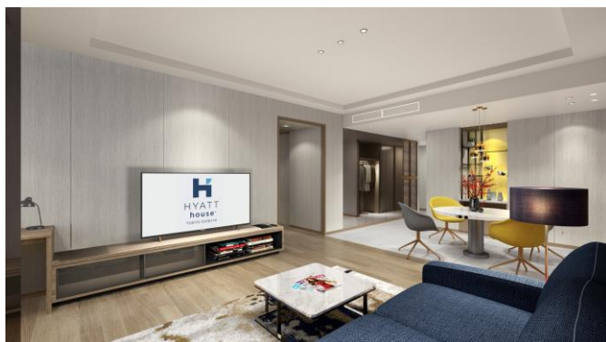
客室イメージ（デラックススイート 85㎡）