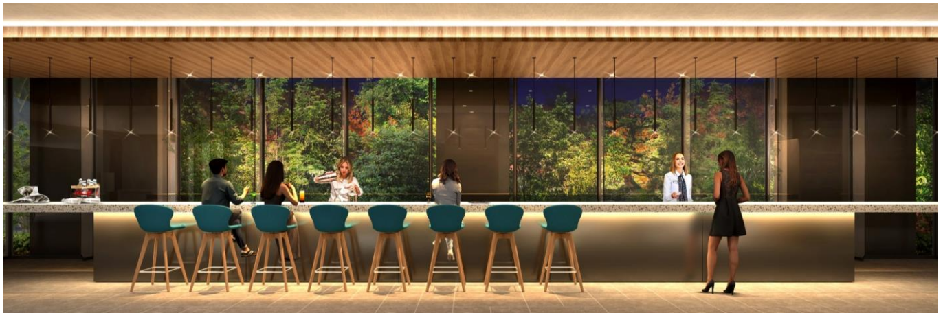
ロビー、ラウンジ&Hバー イメージ

渋谷エリアでは希少な、渋谷のまちを見下ろすことができる屋内プールはプールサイドにジャグジーを配置。24時間利用可能なフィットネスジムと共に、まちの喧騒の疲れを癒す上質で優雅な時間を過ごしていただけます。3階エントランスから各客室まで展開するアートワークは「2面性」をテーマに、渋谷のまちの魅力を発信していく、空間デザインコンセプトと連動したものになっております。