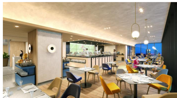
メインダイニング「MOSS CROSS TOKYO」イメージ

「ハイアット ハウス 東京 渋谷」は、100年に一度とも言われる渋谷駅中心地区の再開発プロジェクトにおける主要施設の一つ、「Shibuya Sakura Stage（渋谷サクラステージ）」内に位置し、渋谷駅からは歩行者デッキで繋がり、東京のトレンドをけん引する渋谷の多彩なショップやレストランをはじめ、世界的に有名なスクランブル交差点からもほど近く、まさに東京を肌で感じる都会の中心で気軽に「暮らす」滞在体験を提供します。