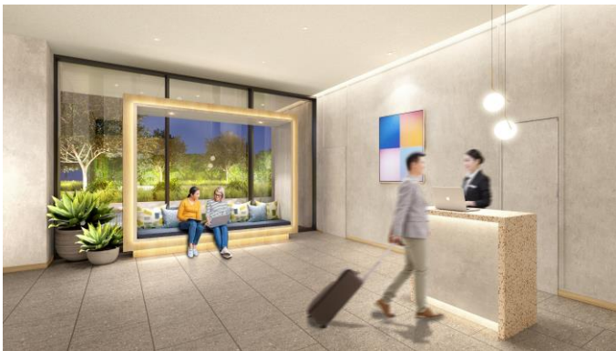
3階エントランス イメージ