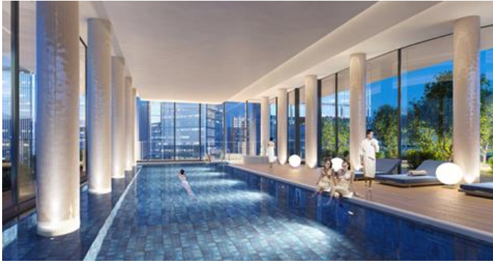
屋内プール イメージ