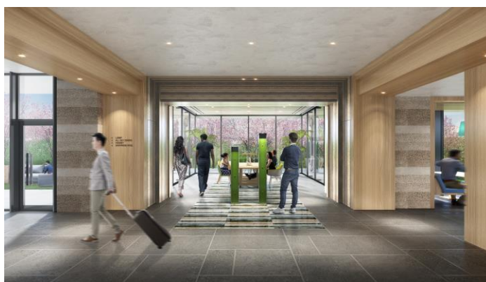
マルチファンクションルーム イメージ