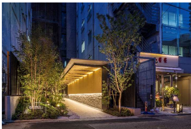
サブエントランス

当社は、緑の力を活用して、ワーカーのストレス軽減や生産性の向上、コミュニケーションの活性化などに寄与するオフィスビルづくりを目指す「Green Work Style」を推進しています。本ビルにおいても、中規模オフィスでありながら、豊かな屋上庭園と2階にはテナント専用のテラスを設けました。WI-FIを完備するこれらの空間では、従来の執務室内の働き方だけではなく、多様な働き方の選択が可能となります。加えて風と自然光、緑を感じることで自然と会話が生まれ、コミュニケーション醸成にもつながる空間を提供します