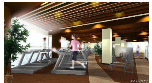
▲マシンジムイメージ

スタジオプログラムやスイミングスクールなど、幅広い年齢層のお客様にご満足いただける多様なメニューをご用意します。