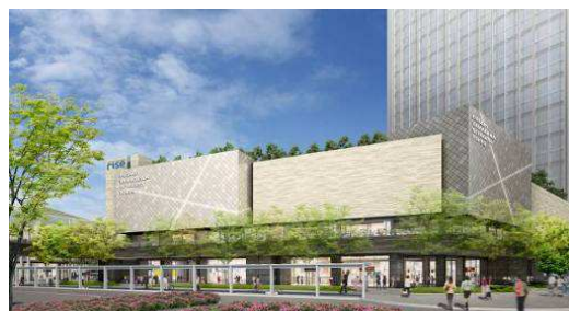
▲交通広場側外観イメージ