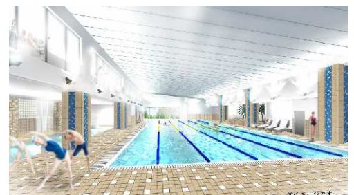
▲スイミングプールイメージ