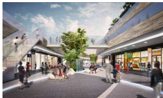
▲リボンストリート沿いの商業施設イメージ