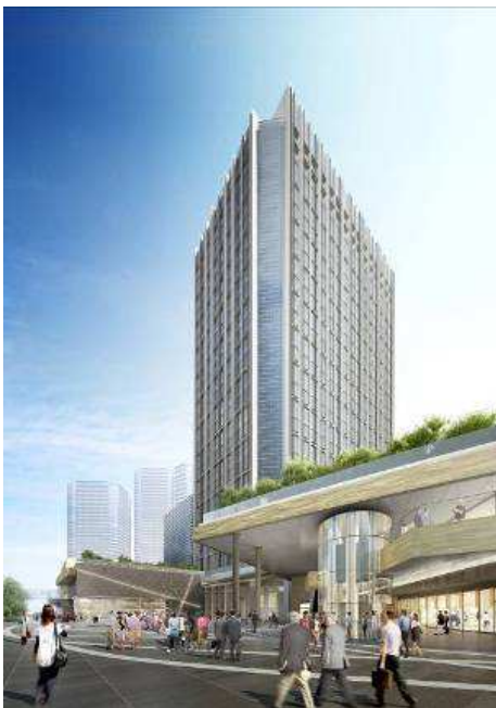
▲高層棟外観イメージ