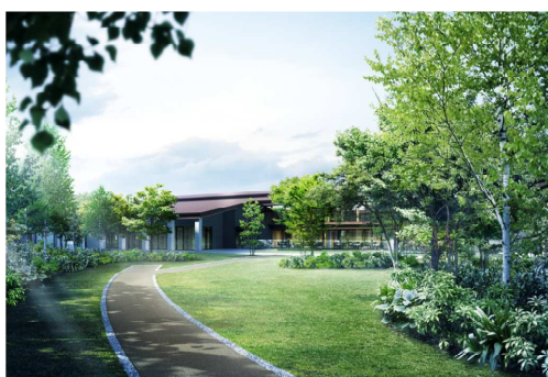
ガーデンイメージ