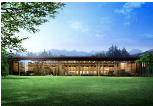
パブリック棟外観イメージ

そのようなランドスケープとあわせて、共用施設として、浅間山を望む露天風呂付大浴場や、嗜好にあわせて選べる3つのダイニングなどをご用意し、ゆったりとした寛ぎの時間をご提供します。