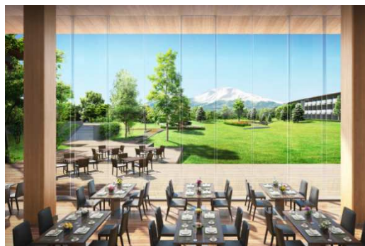
カジュアルダイニングイメージ