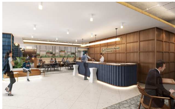
ビジネスエアポート田町 シェアワークプレイス (イメージ)