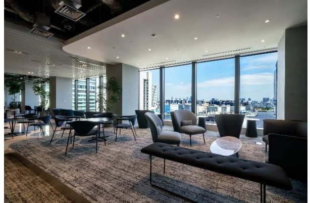
ビジネスエアポート竹芝（2020年9月開業）

なお、ビジネスエアポート各店では、施設内のマスクの着用必須化やアルコール消毒液の設置、座席の間引き、飛沫防止策（アクリルパーテーション設置）に加え、AI温度検知ソリューションを導入し、新型コロナウイルス感染症拡大の防止に努めています。