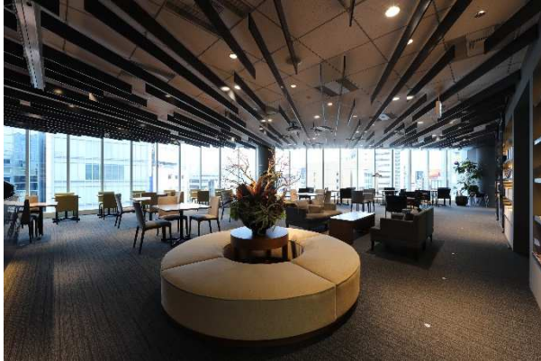
ビジネスエアポート青山（2013年3月開業）