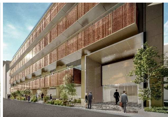
エントランス (イメージ)