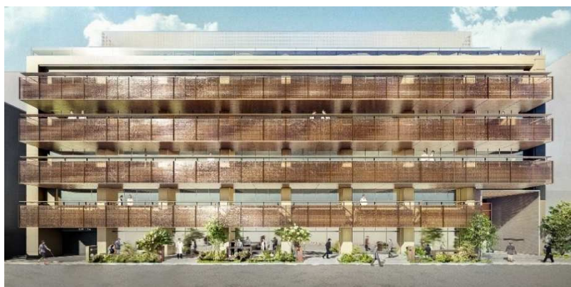
ビル外観 (イメージ)

外観には金属メッシュをガラスに挟んだパネルを採用することで、波のような輝くきらめきと海のような透明感と深みを感じられるデザインとしました。無機質で閉鎖的なラボのイメージを刷新する、都心の洗練された印象を表現しています。(監修：小堀哲夫建築設計事務所)