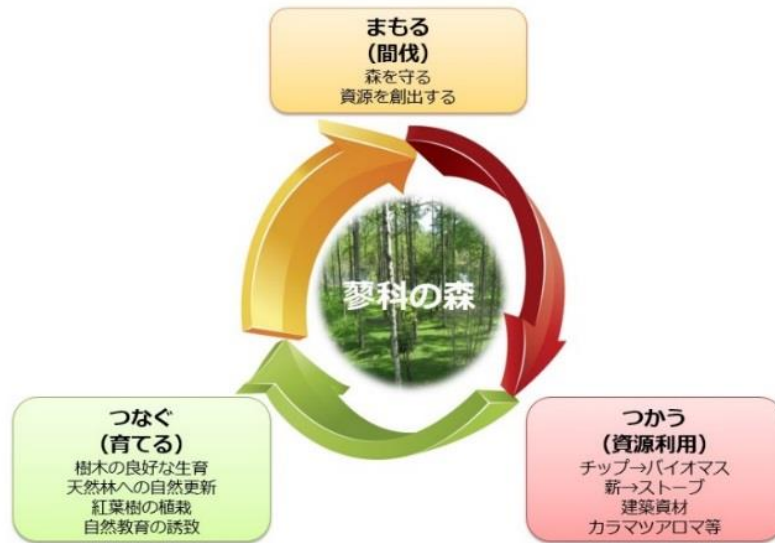
プロジェクトスキーム

カラマツをはじめとする森林資源に恵まれた蓼科の森を舞台に、将来にわたり持続可能な地域循環型の環境づくりを進めてまいります。