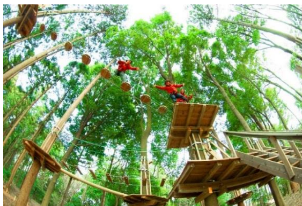
Forest Adventure 蓼科(イメージ画像)

「Forest Adventure 蓼科」では難易度が低めの2つのコースと難易度が高めの4つのコースを計画しており、長野県では最大の施設※で蓼科の豊かな森林を体感いただけます。 ※2017年6月22日現在