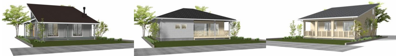
class vesso 蓼科(イメージ画像)

「class vesso 蓼科」ではデッキでBBQを楽しみ、食後には薪ストーブを囲みながらゆっくり団欒する別荘ライフの宿泊体験をお楽しみいただけます。