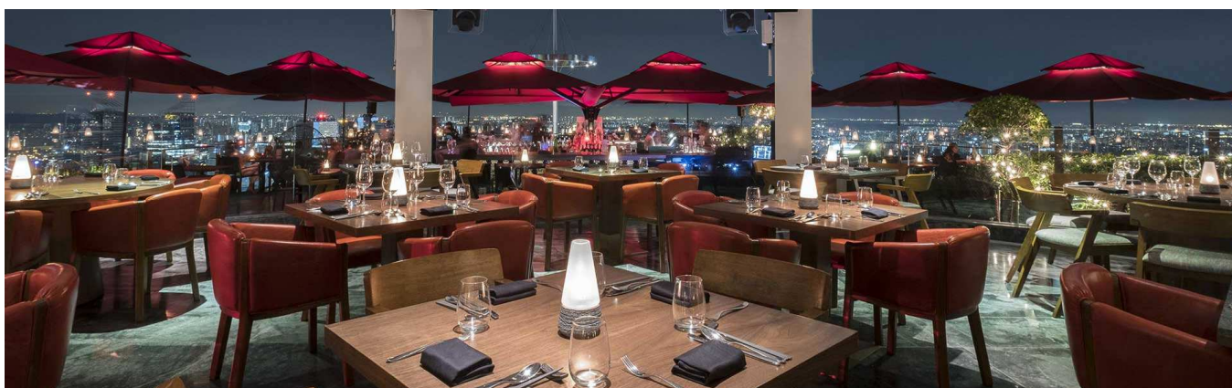
「CÉ LA VI Singapore」Marina Bay Sands