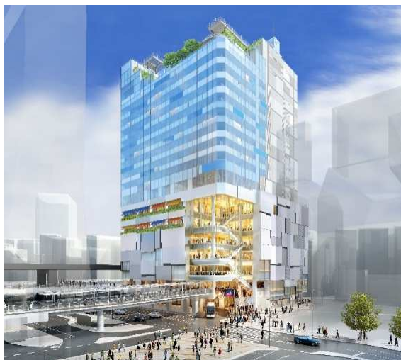
道玄坂一丁目駅前地区第一種市街地再開発事業 外観(北東側)イメージ

※「東急プラザ渋谷」は本プロジェクトの2階～8階、17・18階の商業施設部分の名称です。