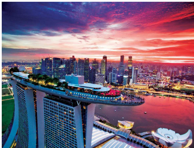
「CÉ LA VI Singapore」 Marina Bay Sands

当社は、2019年秋に竣工予定の東急プラザ渋谷を「MELLOW LIFE(メロウライフ)」を提案する場として、「都会派の感性が成熟した大人たち」をターゲットに、新時代に向けた商業施設を計画中です。