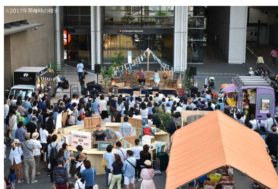
二子玉川ライズ「太陽と星空のサーカス」(2017年)の様子