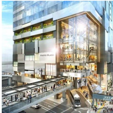
完成イメージ(渋谷フクラス側)