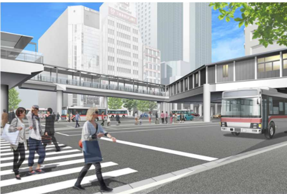
完成イメージ(JR渋谷駅側から見る)