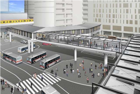
完成イメージ(渋谷フクラス側から見る)