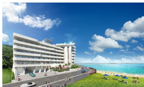
▲本物件外観イメージ