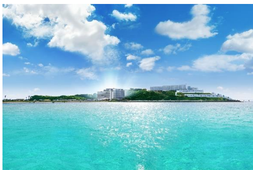
▲海より本物件を望む

東急不動産は、ハイアット リージェンシー 瀬長垣アイランド 沖縄(沖縄県恩納村)、東急ステイ沖縄那覇(沖縄県那覇市)の開発実績に加え、本物件の開発により、沖縄における観光産業の発展、多様化に貢献していきます。