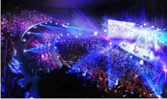
大ホール完成予想パース（今後変更になる可能性があります）

最大7,000人収容の大ホールとライフスタイルホテル、エリアマネジメント施設などの整備を目指してまいります。エリアマネジメントの活動拠点の中心となる施設は、現中野サンプラザの機能を継承しつつ新たな交流機能を加えます。