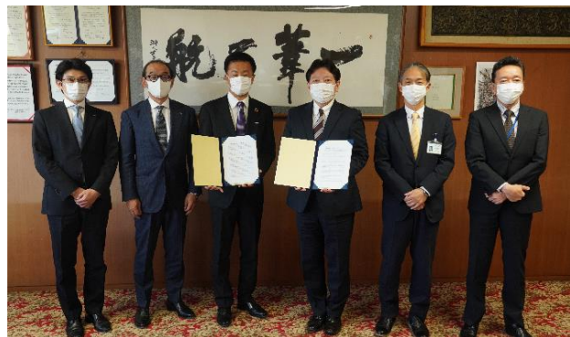
2021年5月6日 基本協定書締結式