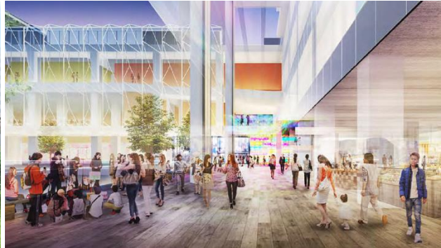
歩行者空間完成予想パース（今後変更になる可能性があります）