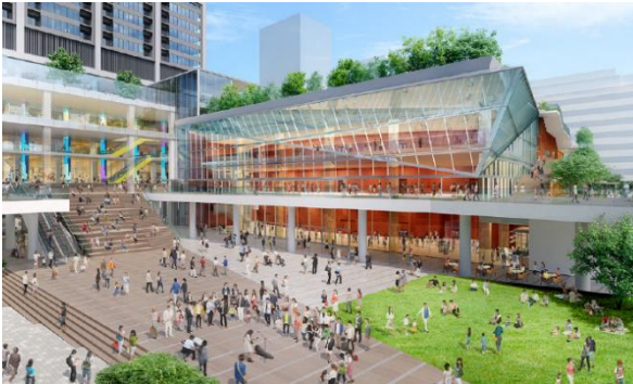
集いの広場完成予想パース（今後変更になる可能性があります）

中野駅西側南北通路・橋上駅舎（駅ビル）の整備や新区役所整備などの関連事業や周辺環境を踏まえ、広場や歩行者空間を整備することで、新たな交流と賑わいを創出します。