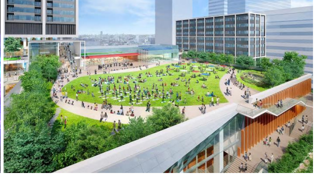
屋上広場完成予想パース（今後変更になる可能性があります）