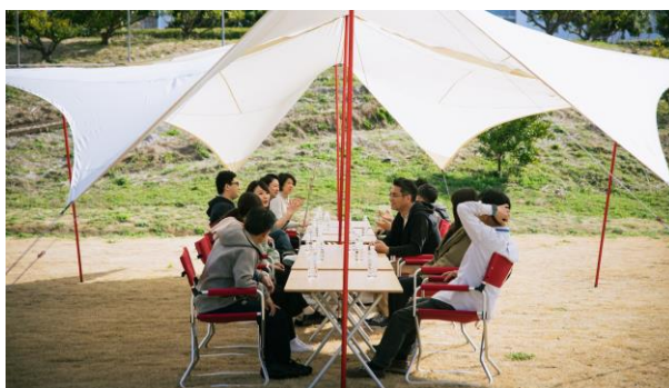
CAMPING OFFICE HAMANAKO

すでに展開中の CAMPING OFFICE HAMANAKO を利用しての研修では、自然の中で会場設営から行い、チームビルディングもでき、コロナ禍で不足していた社員のコミュニケーションも図れます。自然の圧倒的な開放感を五感で感じ、いつもと違うアイデアやつながり、絆が生まれます。