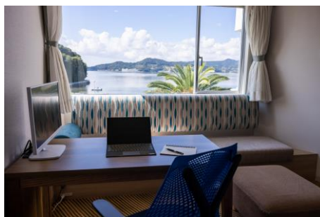
ホテルハーヴェスト浜名湖