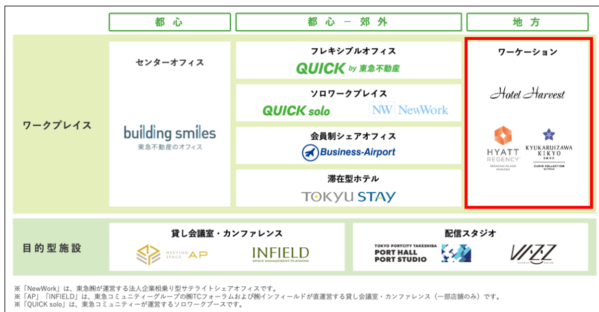
東急不動産ホールディングスグループが提供する多彩なワークスペース

リゾート地で働く「ワーケーション」においては、東急リゾート&ステイの運営する「ホテルハーヴェスト」にて、ワーケーション利用時の利便性向上へ向け、施設強化に取り組んでいます。