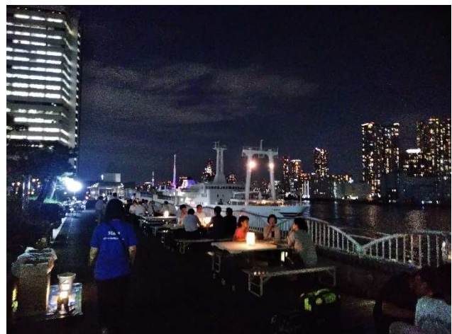
竹芝ふえす 2019 開催の様子