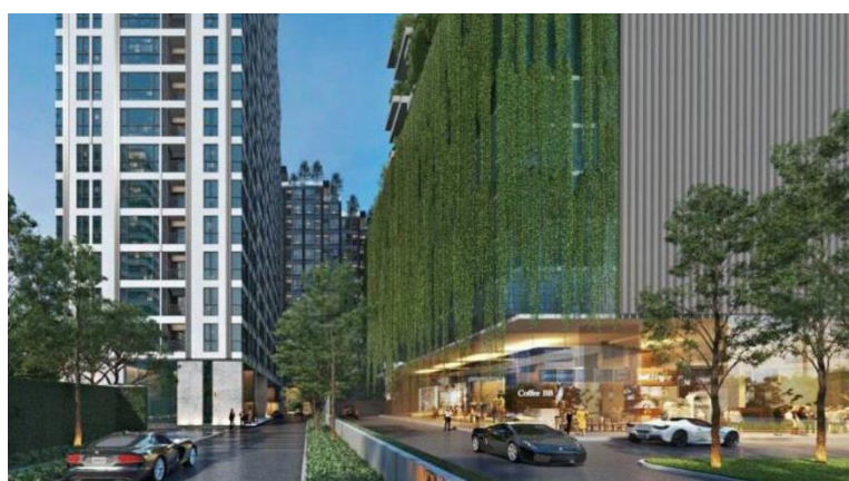
上、左）完成予想図（外観）