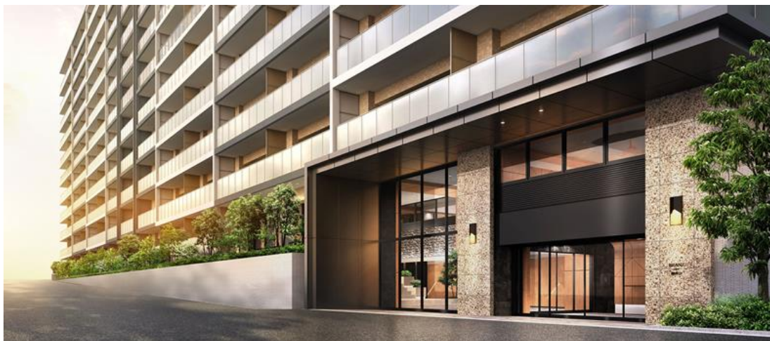
建物外観（完成予定図）

ブランズシティ湘南台は小田急江ノ島線、相鉄いずみ野線など3路線が乗り入れ、うち2路線が始発の「湘南台」駅から徒歩圏の立地であり、南向き中心で開放感あふれる180戸の大規模レジデンスです。ブランズシティ湘南台の商品計画にあたっては、ワークショップを開催し、実際に大規模マンションに住まわれている方の声を反映することをコンセプトに、ワークスペースやキッズルーム、パーティールームなどの多彩な共用施設をご用意するなど、住まう方の目線で理想のレジデンスを目指しました。平置き駐車場は全住戸の約70%をご用意しました。都心からのアクセスもよく、自然豊かな藤沢市はテレワークをする若い世代を中心に注目を集めています。