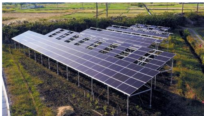
リエネソーラーファーム東松山太陽光発電所