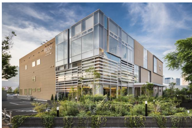
ブランズタワー豊洲マンションギャラリー

※2 棟外マンションギャラリー8棟(年間消費電力36,000kw/棟)、棟内インフォメーションサロン2棟(年間消費電力600kw/棟)と想定した場合。