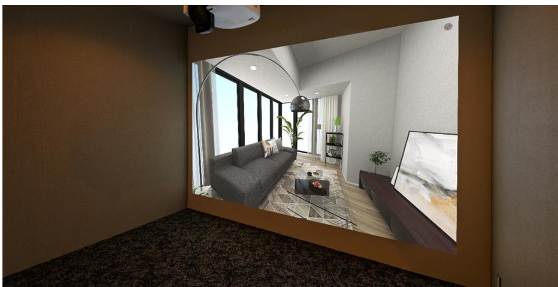
ブランズ南草津マンションギャラリー VRシアター ※提携家具コーディネートはリビング・ダイニングと一部の居室のみ

9月18日より「ブランズシティ南草津」マンションギャラリーでは、全51タイプVRモデルルームを約2.8m×1.9mの大画面シアターで公開。4K画像でよりリアルな体感をお楽しみいただけます。