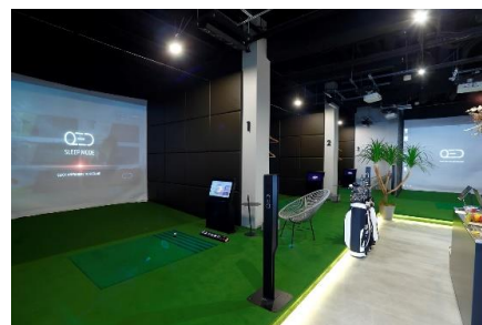
ゴルフスタジオ内