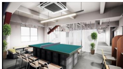
4階 サービスオフィス利用者専用ラウンジ