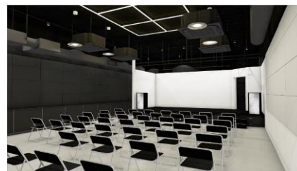
ライブ配信スペース（パース）

コンソーシアムメンバーによるイベントや、渋谷駅前の立地を活かした様々な外部イベントの開催などを行うことを通じて、新たな人のつながりとイノベーション創出のきっかけづくりを行います。