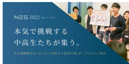
Loohcs 社運営の起業家講座

NIB コンソーシアムにおいて、Loohcs 社はこうした若年世代のビジネスとの関係性の構築に貢献する予定です。