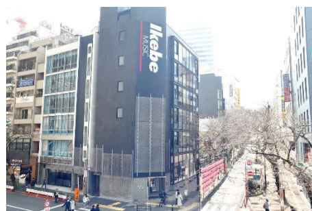
桜丘フロントビル外観

※「未来シェアリング」は、当社が掲げる広域渋谷圏における、起業、アイデア創発、コミュニティ連携を促す取り組みのコンセプトです。「渋谷の魅力を高めるエリア開発」「渋谷に集まる企業のニーズへの対応」を行い、よりよい毎日を描く街づくりを通じて、すべての人と「未来」を共有していきます。