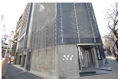
桜丘フロントビルエントランス