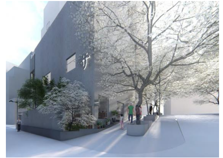
渋谷サウナス 外観パース