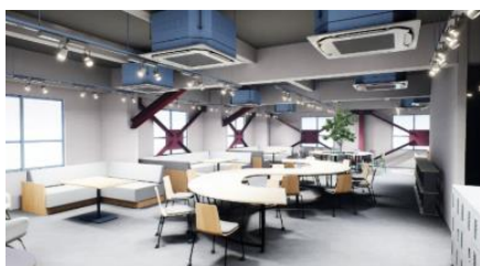
3階 コワーキングスペース