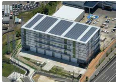
リエネ枚方 LOGI'Q 太陽光発電所

地域の方々・協同事業者・投資家などの皆さまとつながりながら、ともに事業をつくっている様子、そこから生み出される力を矢印の形にデザインしました。グリーンは東急不動産のブランドカラー。深いグリーンは大地、イエローはエネルギーを表します。