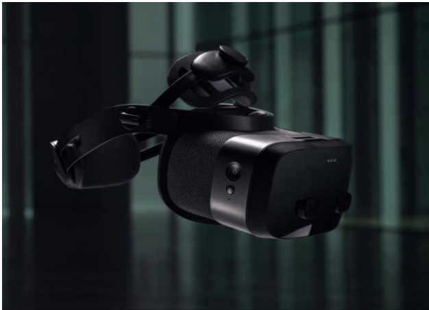
<VRゴーグル Varjo XR-3 >

今回そのリアルな体感を共用部VR体験に活用しましたが、これは建築業界においては世界初の試みとなります。