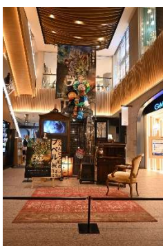
えんとつ町のプペル展

東急不動産と CHIMNEY TOWN は、2020 年 12 月「映画 えんとつ町のプペル」公開に合わせて、物語の舞台のモデルとなった渋谷の街で、東急プラザ渋谷を中心に「えんとつ町のプペル展」を開催しました。その後、2021 年 4 月～6 月渋谷区桜丘町において、期間限定カフェとして「CHIMNEY COFFEE×000Cafe」を共同で取り組みました。コロナ禍の逆風にも関わらず、オンラインコミュニティがリアルな店舗の活性化に大きく寄与したことから、今後のまちづくりの在り方を見据えて、オンラインとオフラインにまたがるコミュニティづくりに取り組むに至りました。