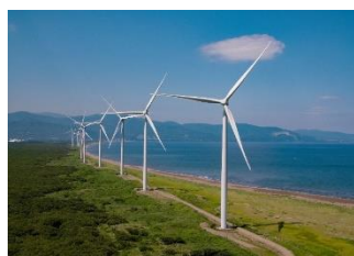
リエネ銭函風力発電所 （北海道小樽市）

今後も、再生可能エネルギーの成長とともに、再生可能エネルギーをベースとした地域社会へのソリューション提供を図ってまいります。