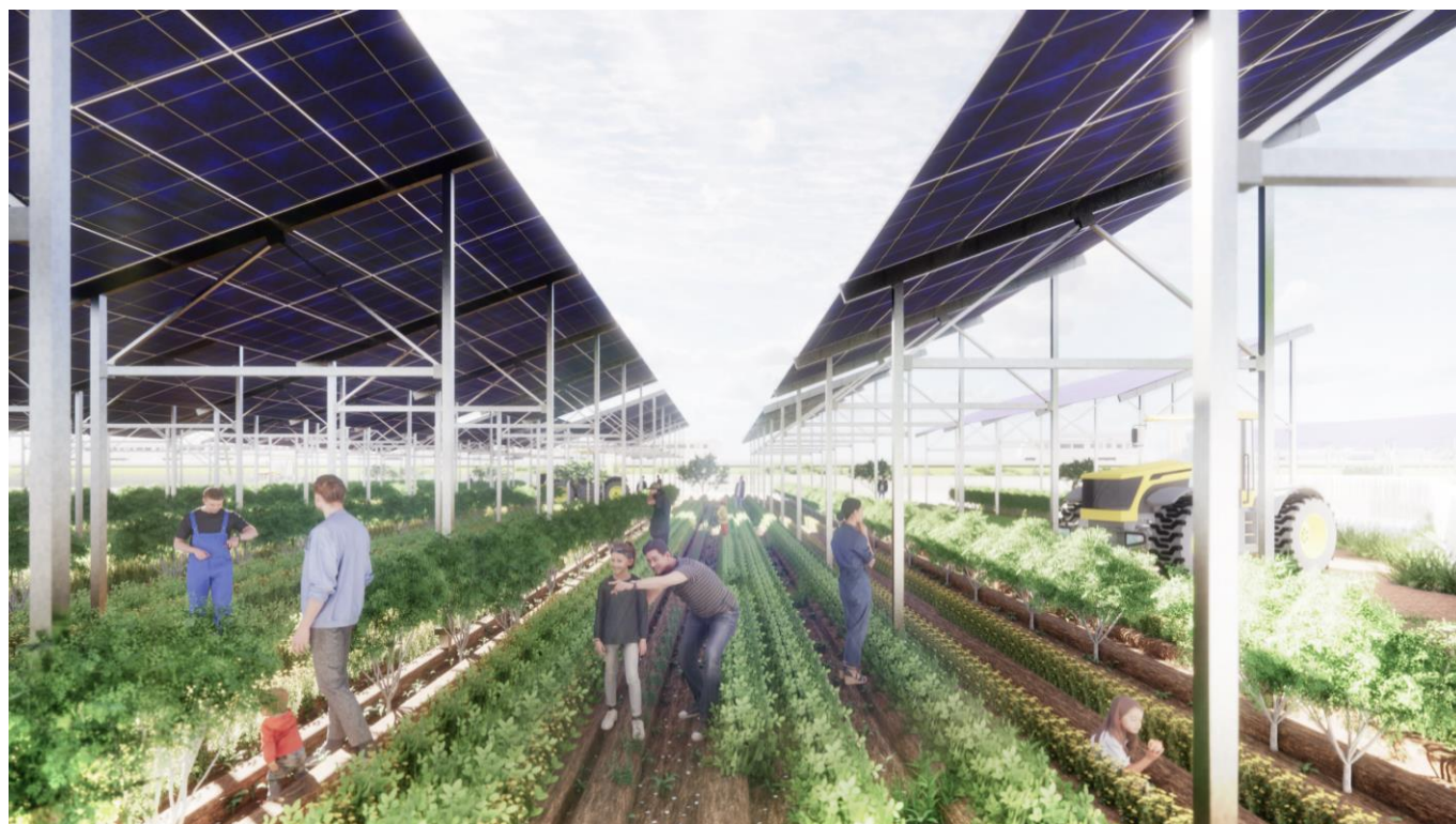
発電所下部での営農イメージ

埼玉県東松山市内でソーラーシェア事業を展開するため、東急不動産は EXEO とソーラーシェア事業実証パートナーシップ契約及び工事請負契約を締結しました。今回の契約締結により、東急不動産と EXEO は効率的なソーラーシェア発電所開発・運営、最適な発電量を確保する為の検証や作物生育データ収集・分析を通じた収穫高や栽培品質に影響の少ない営農実証など様々な取組みを協業し、ノウハウ獲得することで今後のソーラーシェア事業拡大と食料・農業課題解決を実現します。