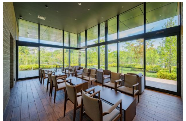
共用棟 (離れ) から臨むフォレストガーデン