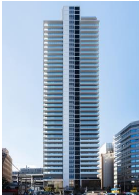
ブランズタワー御堂筋本町