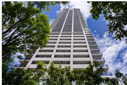
ブランズタワー梅田 North