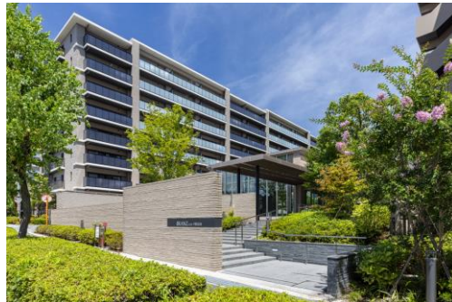
ブランズシティ千里古江台