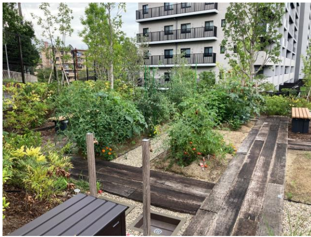
貸農園 (グリーンファーム)

また、コミュニティ醸成の核として住棟から独立した場所に計画した「離れ」という別空間は、全面ガラス張りの窓の外に豊かな自然が広がっており、まるで森の中の別荘のように非日常を感じられる空間になりました。不整形な敷地形状の敷地西部には、貸農園スペースや収穫体験イベント等が定期的で開催されるグリーンファームを配置して、作物の成長を共に学び楽しむ機会を提供しています。敷地の形状や高低差をうまく活用した緑化空間の整備と、緑による入居者同士のコミュニティ形成のための工夫が高く評価されました。