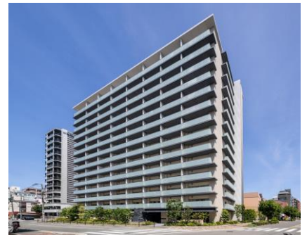
ブランズ天王寺国分町