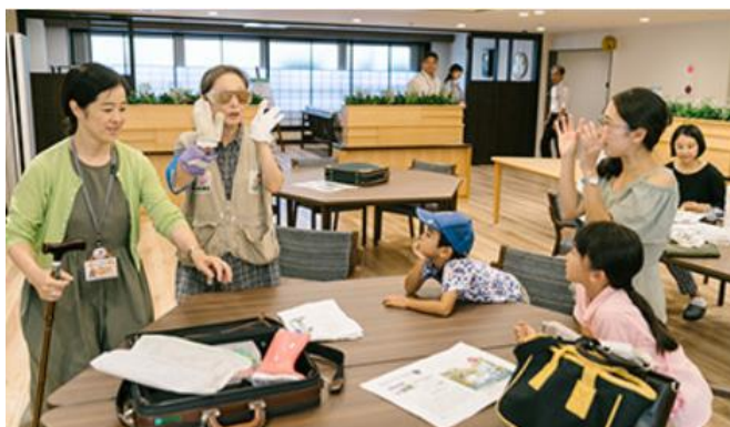
世田谷中町プロジェクト 街びらき 「世田谷中町まつり」の様子

これまで、人々の交流の拠点を生み出し、多様なライフステージに応える街を開発してきた「グランクレール」シリーズが、今回新たに「HARUMI FLAG」の一角に誕生します。