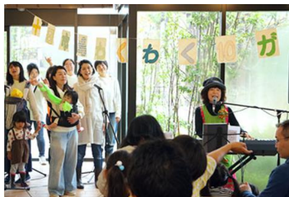
十日市場プロジェクト 街びらき 「YOKOHAMA GREEN BATON PROJECT」の様子