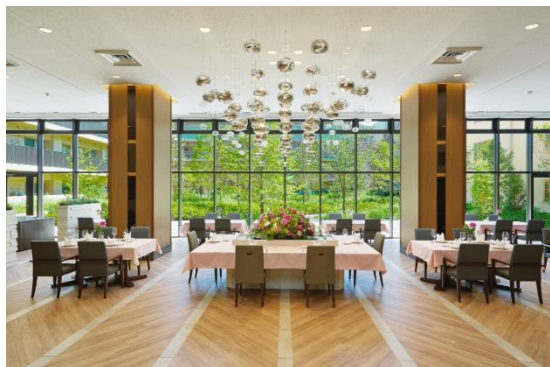
グランクレール世田谷中町