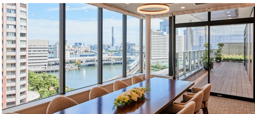
グランクレール芝浦