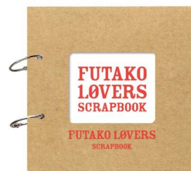
「FUTAKO LOVERS SCRAPBOOK」 ※画像はイメージです。

さらに、スタンプを集めるとプレゼントがもらえるスタンプラリー企画も実施予定です。