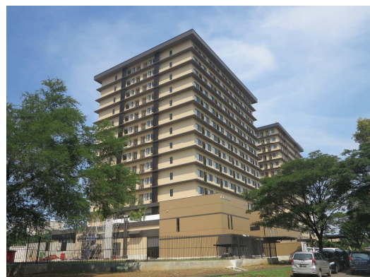
アクシア・サウスチカラン第2期客室棟外観 (手前)

このような環境の中、第2期客室棟では、新たに6タイプ・225室の客室を増設、第1期客室棟と合わせて全12タイプ・405室を提供し、長期滞在者及び出張者の幅広いニーズに応えます。また、棟内には、開放的な大浴場と半露天風呂、カジュアルイタリアンレストラン、美容室、シミュレーションゴルフなどを備えるほか、ビジネスセンターを新たに設け、快適な暮らしとビジネスシーンの両方をサポートします。アクシア・サウスチカランは、お客さまの声や経験・ノウハウを生かし、さらなる利便性と日本品質のおもてなしを追求します。