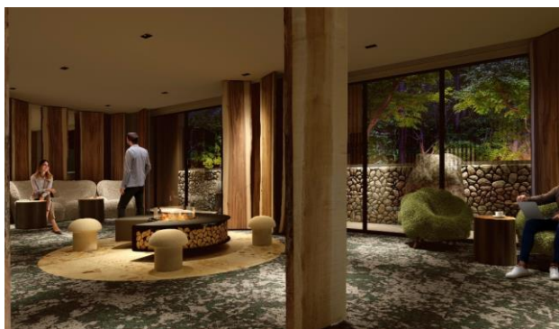
エントランスイメージ

また、サウナ付き温泉大浴場を設け、軽井沢では珍しい温泉を、北軽井沢・応桑温泉からの運び湯を使って楽しめるようにしております。