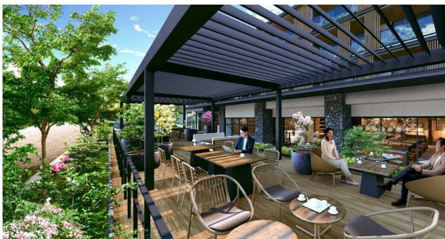
旧軽井沢銀座通り沿いレストランテラスイメージ

本ホテルでは、軽井沢に訪れた人に利用していただけるよう、旧軽井沢銀座通り沿いにレストランテラスを配置しました。本格的なイタリア料理で軽井沢の四季の美味を味わっていただけます。また、旧軽井沢銀座通り沿いの紅葉並木を継承し新たにイロハモミジを植樹することで、食事中も軽井沢の四季折々の変化をお楽しみいただけます。