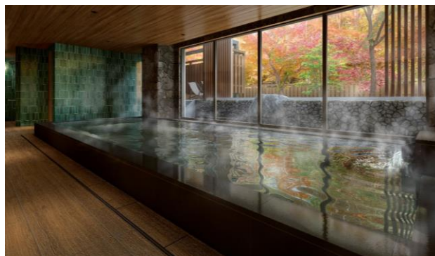
サウナ付き温泉大浴場イメージ