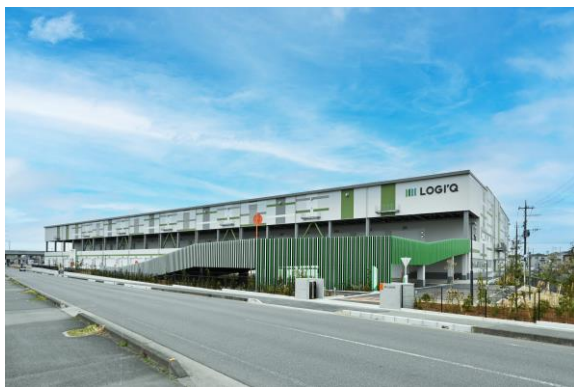
LOGI'Q 白岡 II 外観

本物件は、当該エリアでは希少なスロープを有した3階建ての構造で、災害時用の防災備蓄倉庫などを備えるほか、太陽光パネルを屋上に設けて一部使用電力を自家消費するなど、環境に配慮した設計の次世代型の物流施設です。