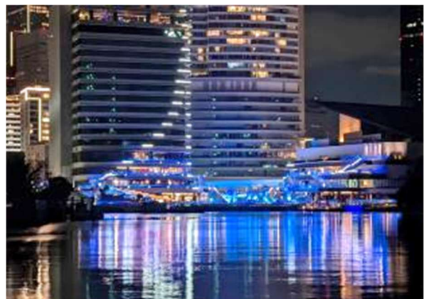
ウォーターズ竹芝のライトアップ