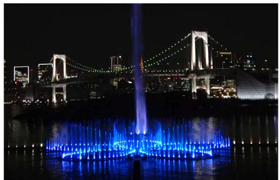
東京アクアシンフォニー