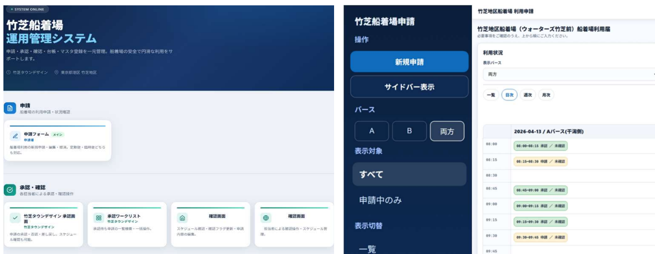
管理画面イメージ(開発時)

これらにより、竹芝地区船着場の利用承認にかかる一部業務の削減およびフローの短縮を行い、船着場を活用した自主企画の開催や、他事業者による船着場活用の促進を図ってまいります。