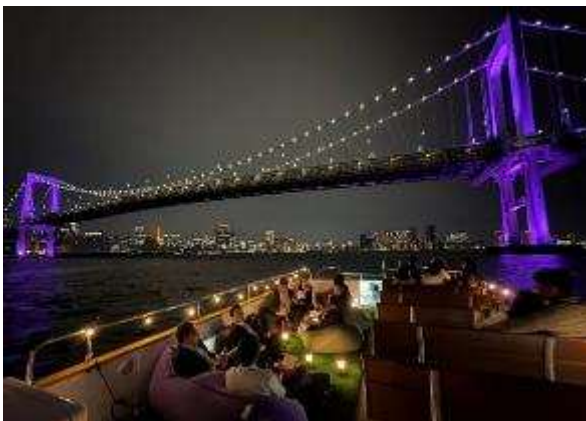
クルーズ取り組みの様子

竹芝地区では、竹芝地区船着場を舟運の拠点とするだけでなく、水辺のポテンシャルを活かし回遊・ナイトタイム等の観点から、様々なクルーズの取り組みや水辺のライトアップ等を実施し賑わい創出に取り組んできました。