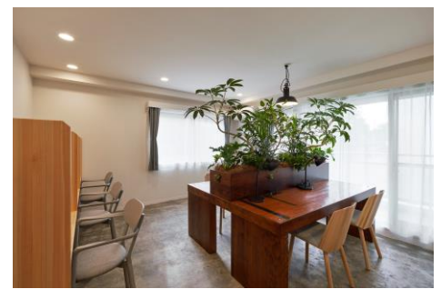
2階ワークスペース