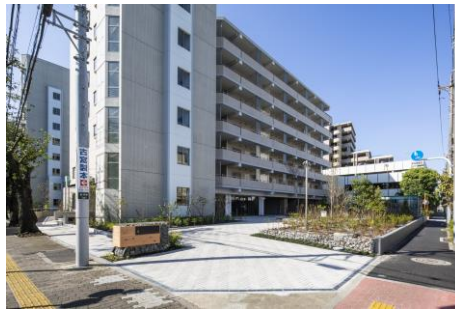
北側広場 街に開かれた広場を設け コインランドリーも誘致