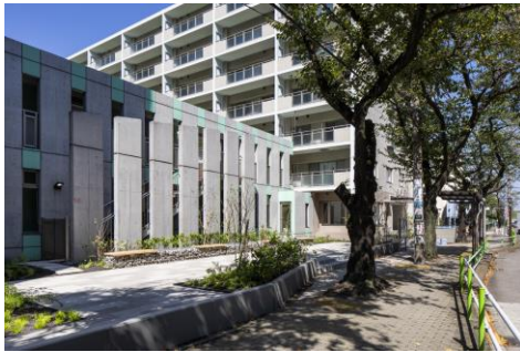
東側広場 歩道やバス停と一体となった 広場をデザイン

一定の耐震性を担保している築30～40年程度の集合住宅や社宅は、昨今の新しい建築よりも豊かな共用部を内外に持ち、コロナ禍以降ますますその価値が見直されている。「コンフォリア高島平」は愛着のもてる廃材を利用して、ゆとりあるランドスケープを地域との交流を育むスペースに再生している。特に、地域住民が自由に利用できるバス停が一体となった広場が素晴らしい。新たに設けられたワークスペースやプレイルームと共にこの場で過ごす時間が、多様な世代にとって確かな記憶に残るようなかけがえのない建物になるであろう。