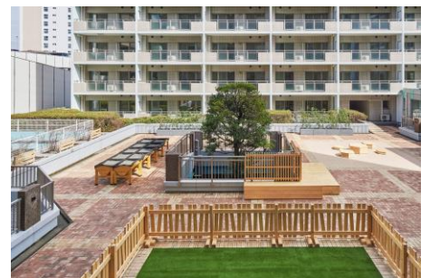
2階デッキスペース (ドッグラン・キッズスペース・共同菜園)

名称：コンフォリア高島平 所在地：東京都板橋区新河岸2丁目1-40 敷地面積：3793.29㎡ 建築面積：1983.23㎡ 延床面積：8480.81㎡ 総戸数：76戸＋テナント1区画 構造規模：RC造 地上8階建 既存建物竣工年：1995年 改修建物竣工年：2022年9月 居室面積：76.26㎡、68.40㎡ 共用設備：デッキスペース（ドッグラン、キッズスペース、共同菜園）、LFCコンポスト、ワークスペース、テレワークブース、プレイルーム、北側広場、東側広場、宅配ボックス、駐車場、駐輪場、防災備蓄倉庫、ゴミ置場、トランクルーム、等 交通：都営三田線「高島平」駅から徒歩10分 間取り：1LDK、2LDK、3LDK 事業主：東急不動産株式会社 貸主：東急住宅リース株式会社 企画、設計・監理、施工：リノベル株式会社 施工：三井物産フォーサイト株式会社