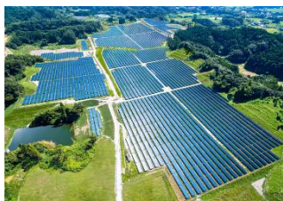
リエネ長南太陽光発電所 （千葉県長南町）