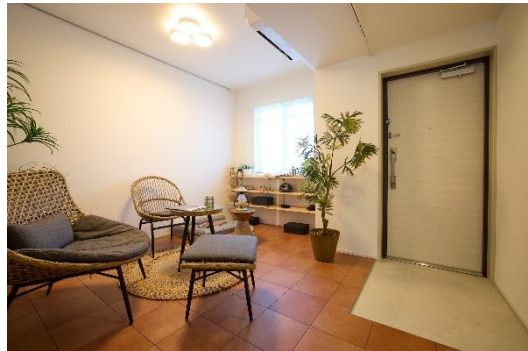
土間プランのリビング・土間