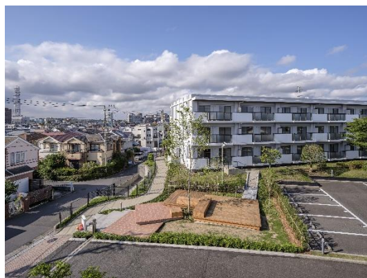
シンボルテラス