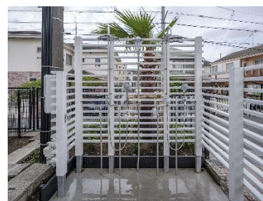
屋外シャワー兼ペット足洗い場

敷地内には海上がりにそのまま利用できる屋外シャワー兼ペット足洗い場やサーフボード置場（B棟）を完備し、さらにハイルフ対応の平置き駐車場を85%確保したほか、1戸あたり1.5台（計72台）となるサイクルポートを設置するなど、モビリティ環境も充実しています。