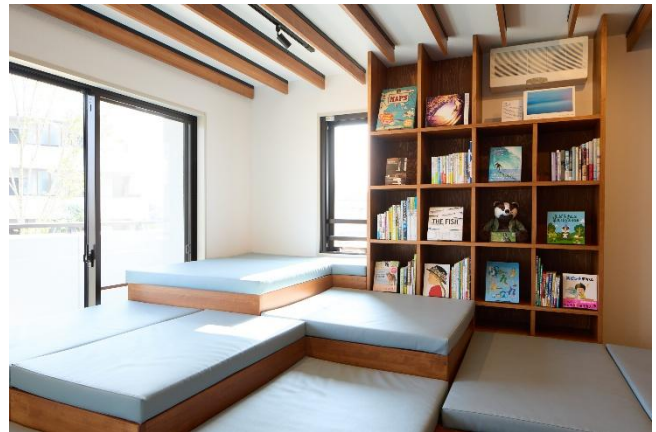
シェアラウンジ「DANDAN LOUNGE」