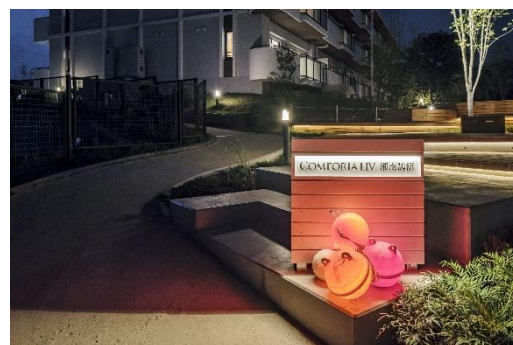
「Pimlico Arts Japan」による 海洋プラスチックゴミを再生した照明

既存建物の躯体を活かしたリノベーションは、建て替えや新築に比べてコストを抑えながら建物を長寿命化し、CO 2 排出量を75%、廃棄物排出量を96%削減（※）できるサステナブルな手法です。本物件内には間伐材や既存樹を活用するほか、館銘板には「Pimlico Arts Japan」による海洋プラスチックゴミを再生・デザインした照明アートを導入。循環型社会の実現とエシカル消費の啓発に貢献します。2026年度内にはEV充電設備の導入も予定しています。