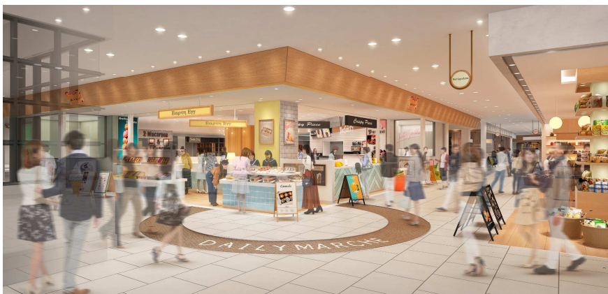
あべのキューズモール地下1階イメージ図

地下1階「食」エリアでは、食関連店舗の拡充に加え、2024年3月に共用通路をリニューアルし、エリア全体のデザインを温かみのある木目調に統一します。“マルシェ”のようにお買い物を楽しめる空間を創出します。