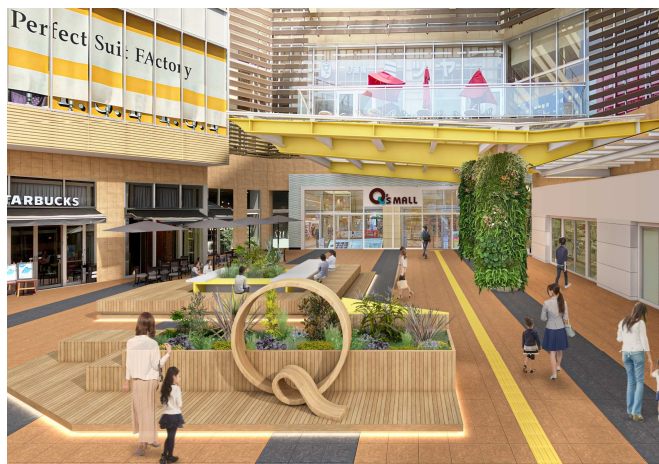
あまがさきキューズモール2階エントランス「きゅ〜ずまえ」イメージ図