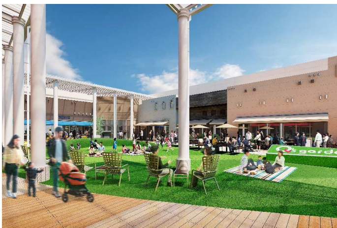
あべのキューズモール4階「Q's garden」イメージ図

あべのキューズモールでは10店舗、あまがさきキューズモールでは6店舗が新たにオープンします。また、施設共用部をリニューアルし、よりくつろぎを感じられる心地よい施設へと進化します。