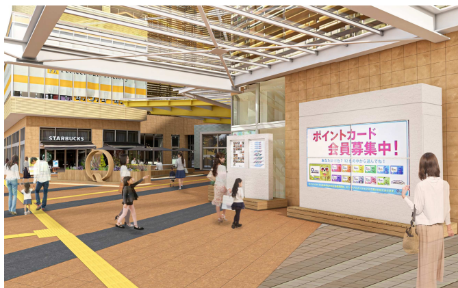
あまがさきキューズモール2階エントランス「きゅ〜ずまえ」イメージ図