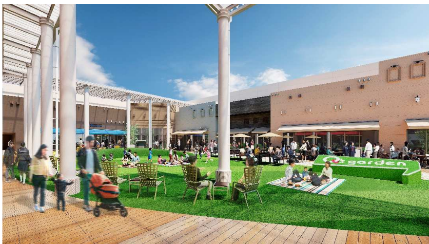
あべのキューズモール4階「Q's garden」イメージ図

2024年7月に、4階飲食フロアの屋外空間「ガーデンエリア」が「Q's Garden(キューズガーデン)」へ生まれ変わり、エリアにおいて希少な「つどい、くつろげる庭」として、皆様に憩いの場を提供します。「Q's Garden」では、新設する人工芝や築山でリラックスできるほか、テラス席で食事を楽しめるなど、子どもから大人まで、快適に、思い思いに過ごすことができます。さらに、オープン後は様々なイベントの開催を予定しており、地域全体の「つどい」の場を提供します。